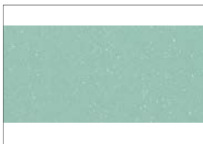
Supporto in Touch Foam micro aerato