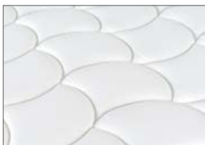
Tessuto rivestimento in jacquard