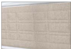
Fascia perimetrale traspirante