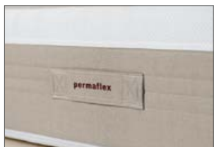
Fascia perimetrale traspirante con maniglie Permafex