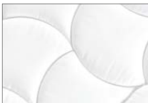
Tessuto rivestimento in jacquard