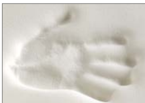
Strato in PiFlex Memory, con spessore maggiorato